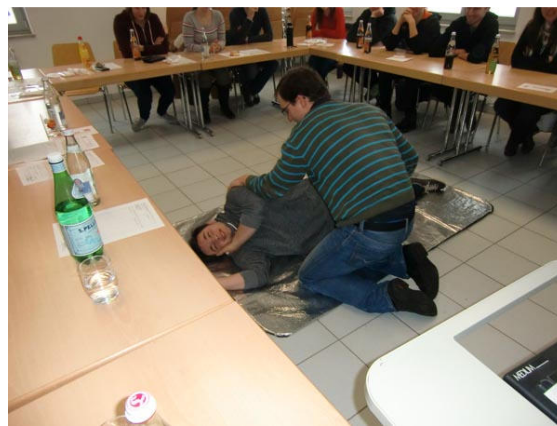
2. Jugendwart und 1. Kommandant bei stabiler Seitenlage